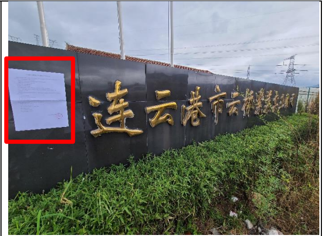
8连云港市云桥紫菜实业公司