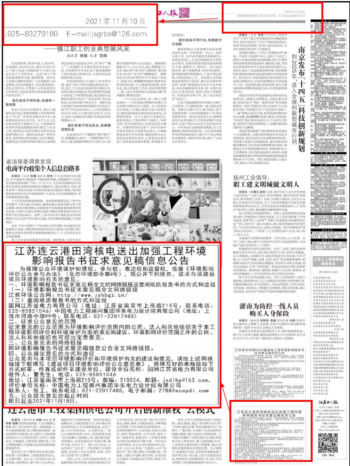
图 3.2-3 《江苏工人日报》截图（2021年11月10日）