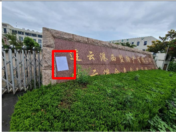
5连云港金喜食品(西墅物产)有限公司