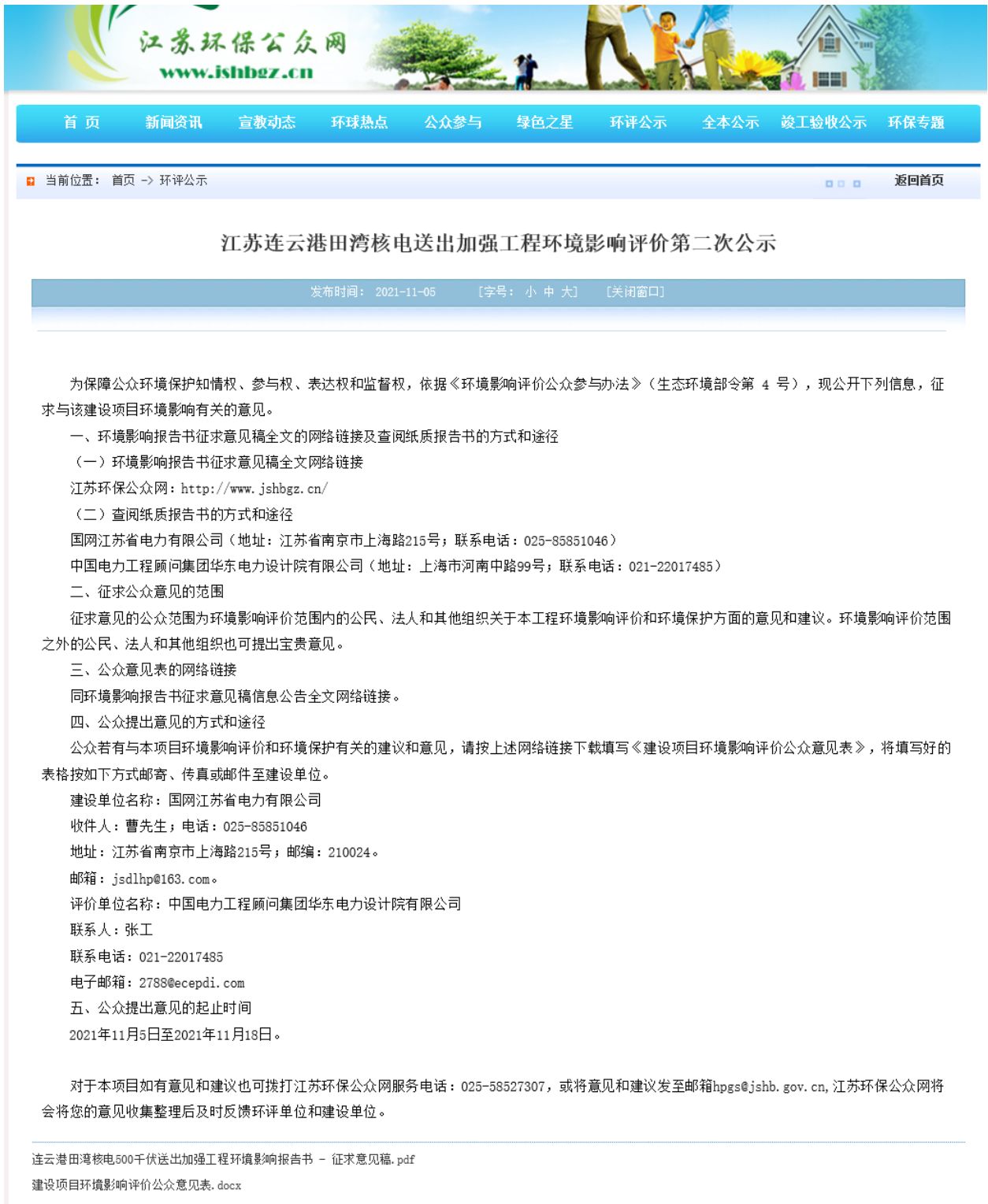
图 3.2-2 第二次信息公示内容（2021 年 11 月 5 日江苏环保公众网）