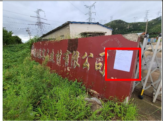
6连云港赛龙建材有限公司