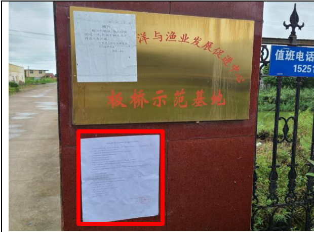
1连云港市海洋与渔业发展促进中心板桥示范基地内鱼塘看护房