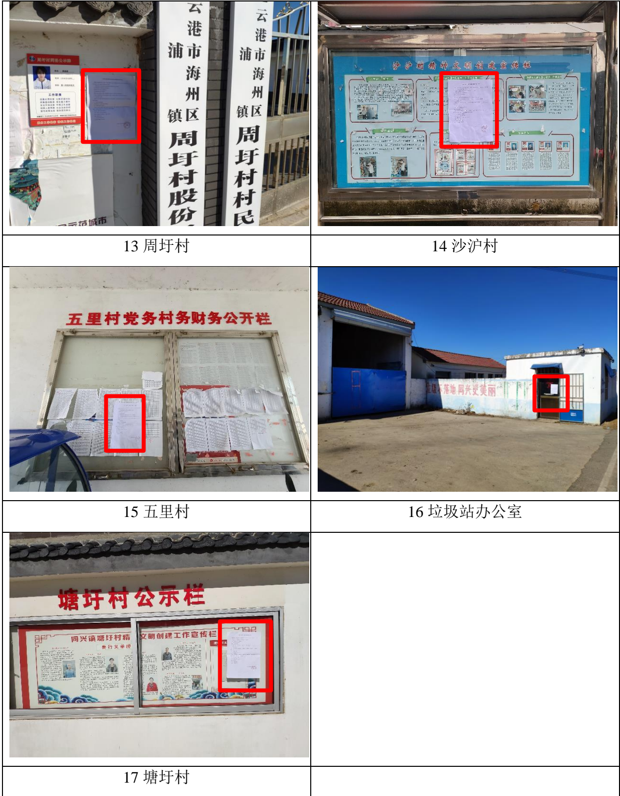
图 3.2-5 现场公示照片