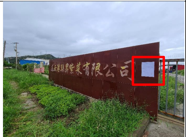
4连云港顺和食品、联昇紫菜有限公司