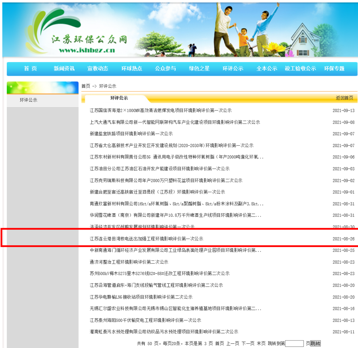
图 2.2-1 第一次信息公示 (2021 年 8 月 26 日江苏环保公众网)