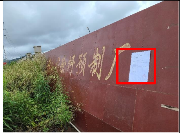
2连云港港务工程公司徐圩预制厂