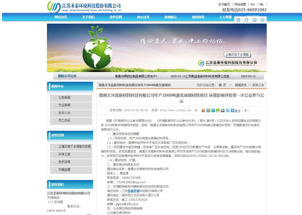
图 2-1 网络一次公示截图