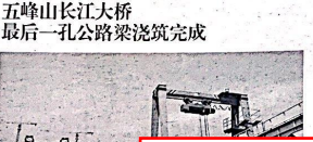
扬子晚报讯(通讯员 彭超)2020年4月3日凌晨3时,最后一孔公路梁架筑完成。

至此,五峰山长江大桥施工全部完成,为今年9月通车奠定基础。五峰山长江大桥南桥主桥为双塔双跨悬索桥,全长2.8公里。