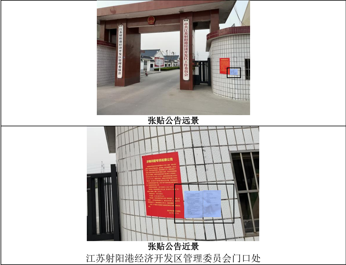
图 3-4 本项目所在地区张贴公告照片