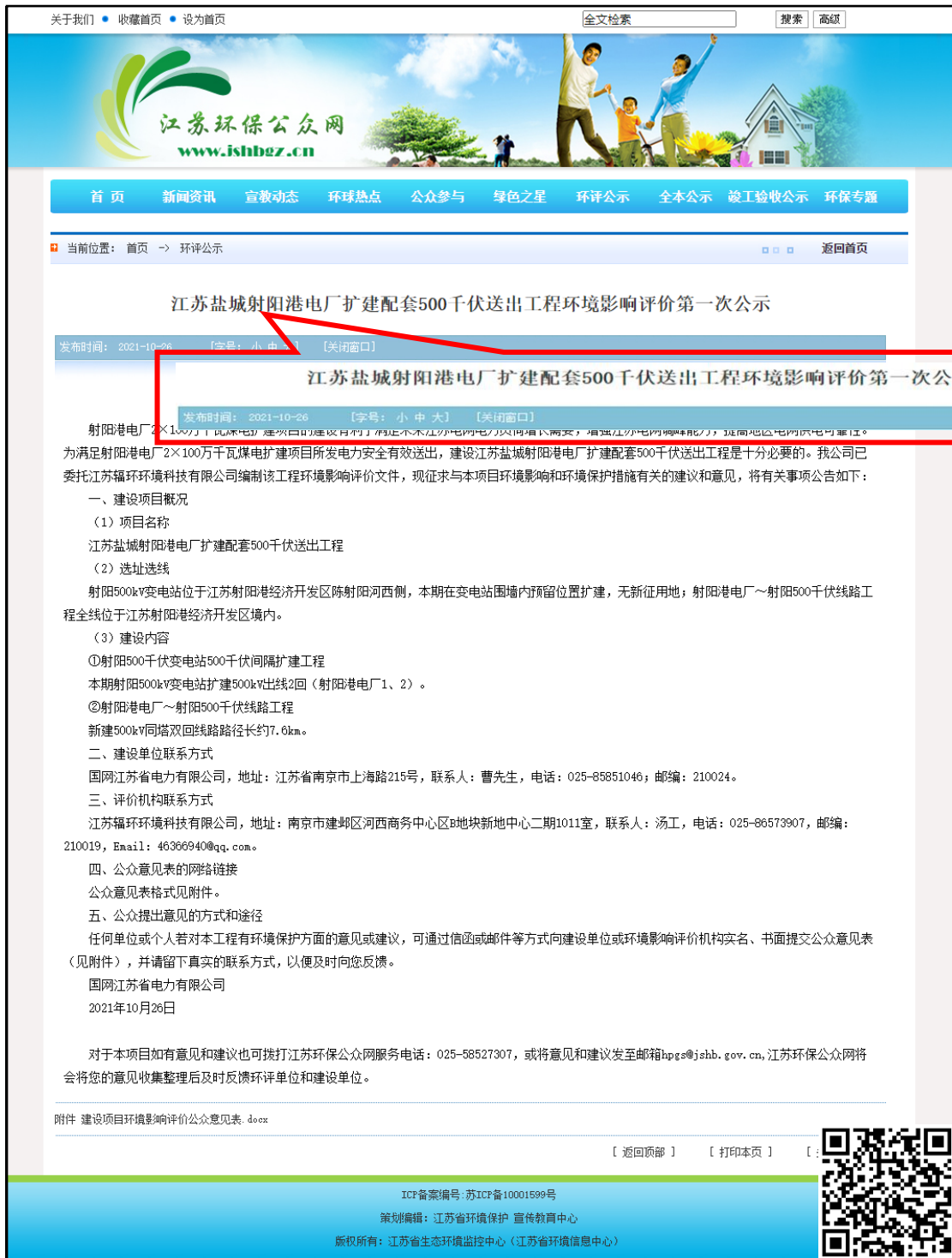
图 2-1 本项目第一次环境影响评价信息公示截图