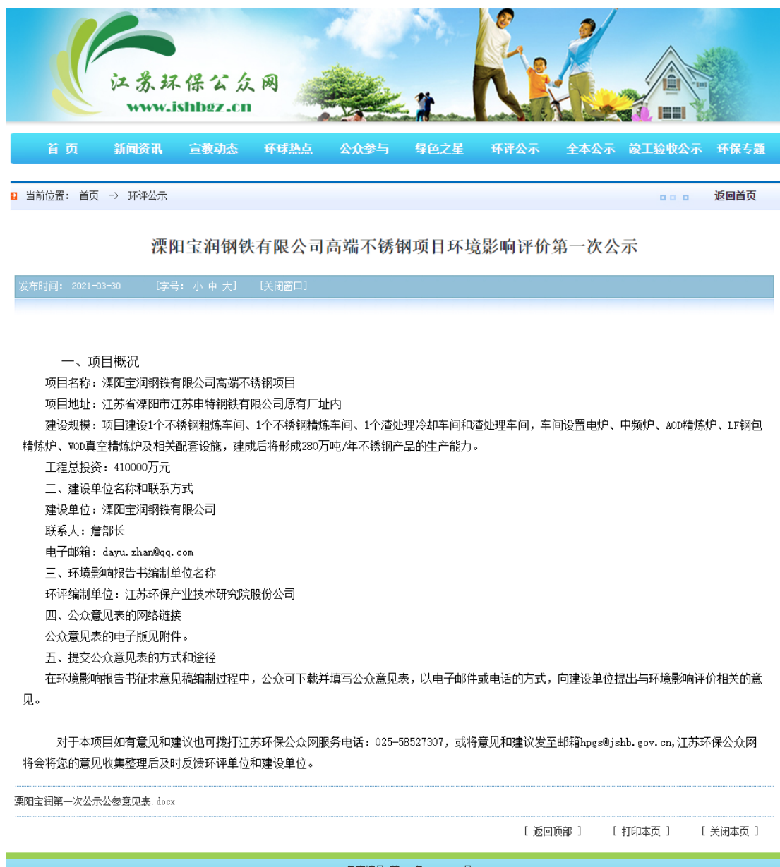
图 2.2-1 江苏环保公众网第一次公示截图