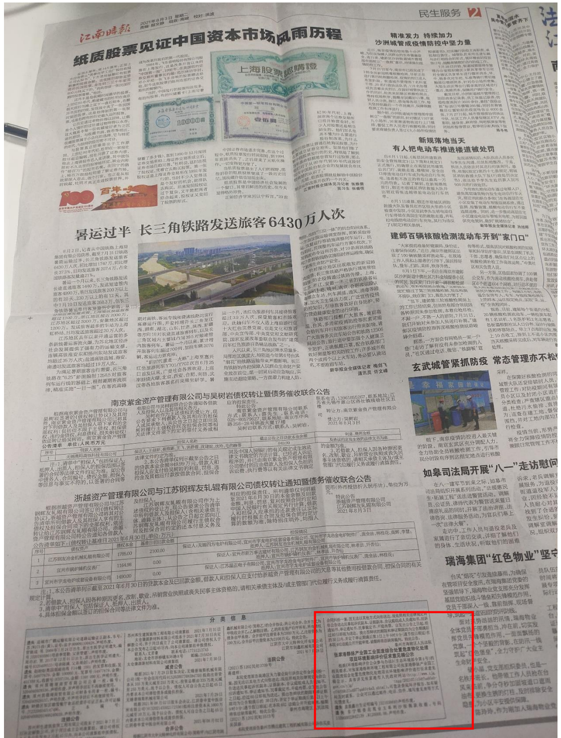
图 3.2-2 本项目第一次征求意见稿报纸公示截图

根据新发布的《环境影响评价公众参与办法》要求，为充分听取公众对建设项目的意见和建议，更好地执行有关国家环境保护的方针政策，建设单位于2021年8月3日和8月6日，在江南时报进行了两次报纸公示，公示报纸截图见图3.2-2及图3.2-3。