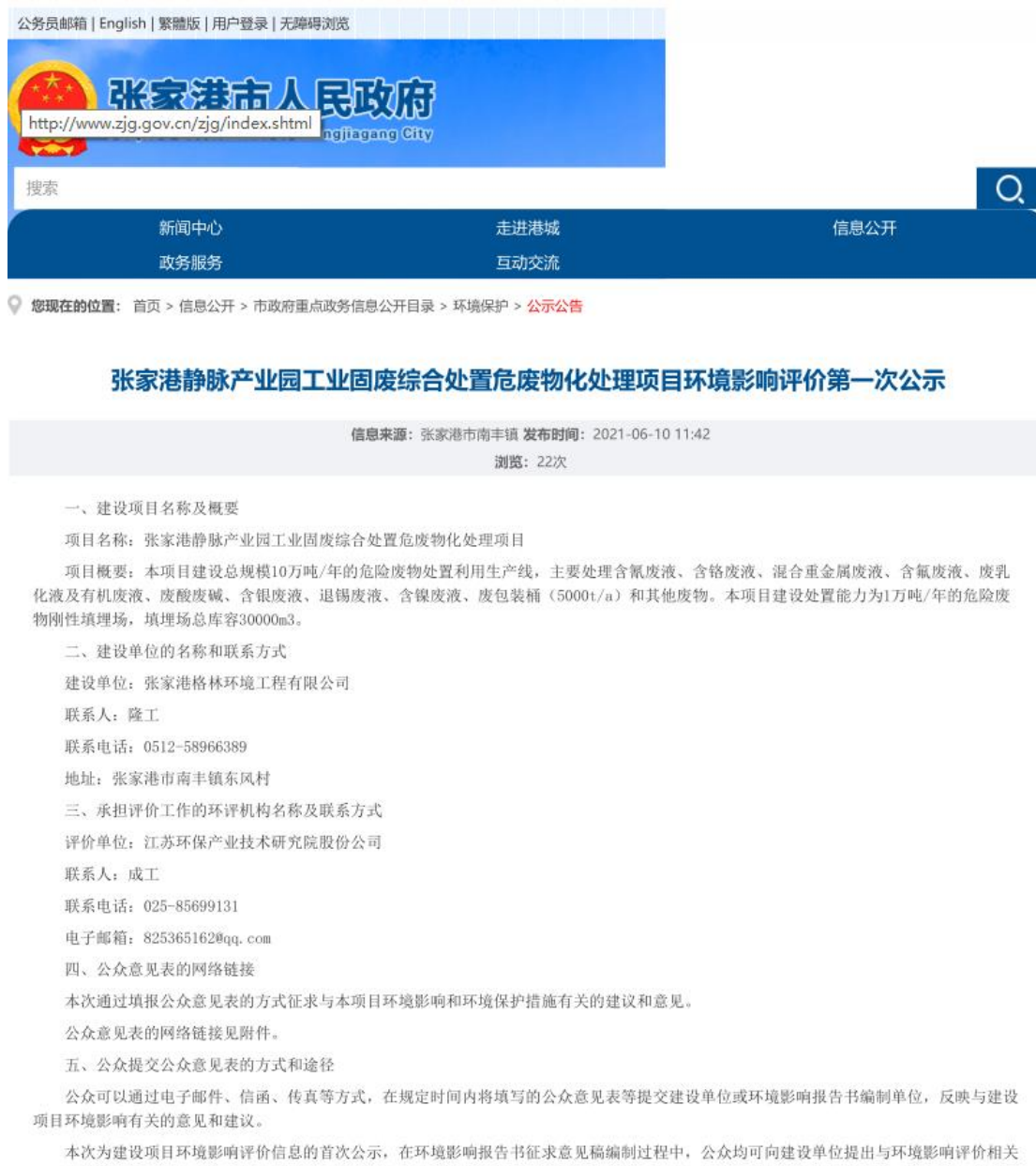
图 2.2-1 张家港市人民政府网站第一次公示截图